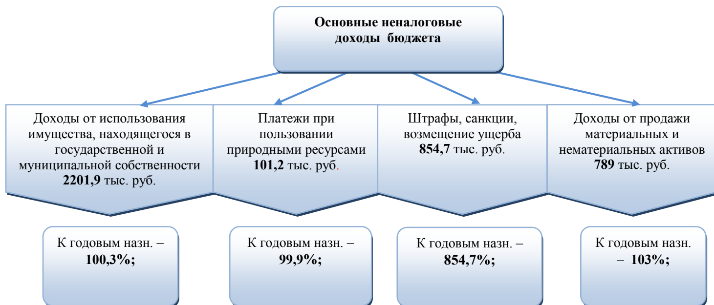
Рис. 2. Исполнение основных источников неналоговых доходов бюджета района

3. Безвозмездные поступления от других бюджетов бюджетной системы РФ в 2020 году запланированы в бюджете района в объеме 268632,4 тыс. рублей. Исполнение составило 268186,9 тыс. рублей или 99,8% плановых назначений из них: