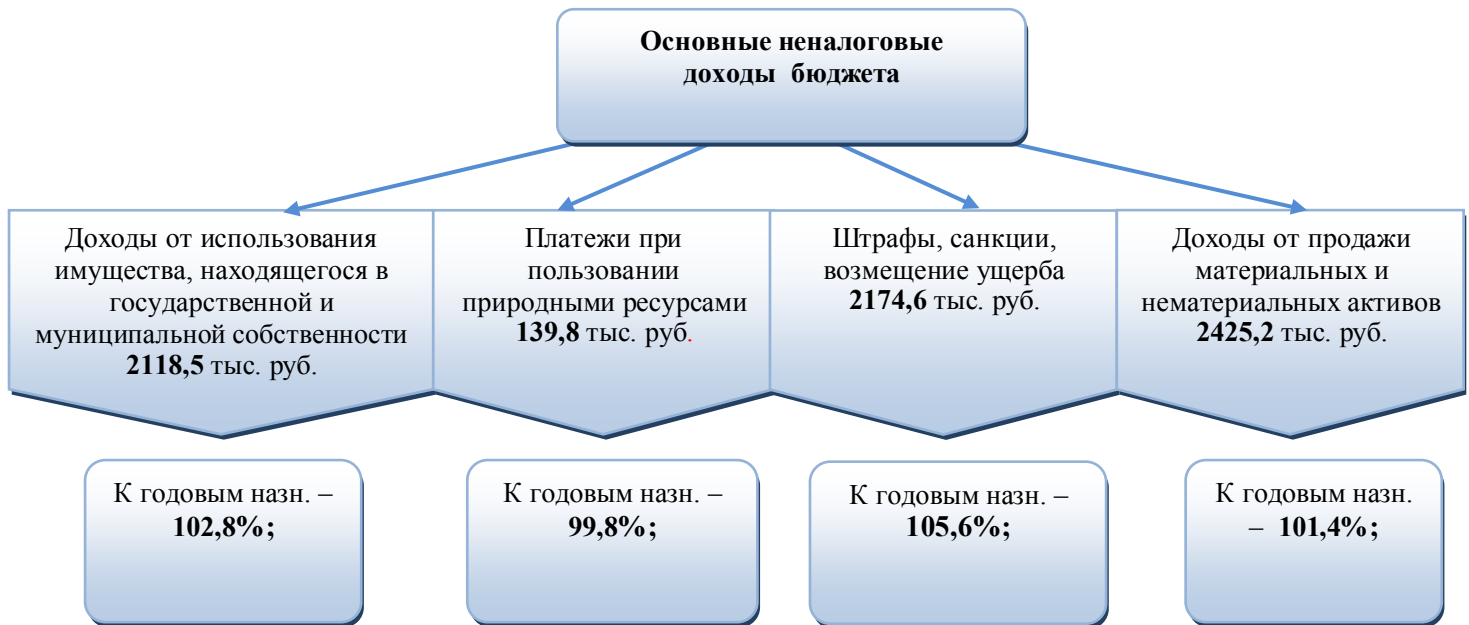
Рис. 2. Исполнение основных источников неналоговых доходов бюджета района

3. Безвозмездные поступления от других бюджетов бюджетной системы РФ в 2021 году запланированы в бюджете района в объеме 259114,0 тыс. рублей. Исполнение составило 258452,1 тыс. рублей или 99,9% плановых назначений из них: